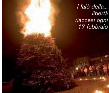
I falò della... libertà riaccesi ogni 17 febbraio

Nei cortili, davanti ai templi, davanti alle case, uomini, donne, vecchi, bambini, portano sterpaglie e legna, accendo-