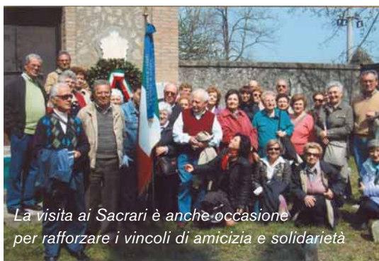
La visita ai Sacrari è anche occasione per rafforzare i vincoli di amicizia e solidarietà