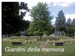
Giardini della memoria

La discriminazione ecclesiale, col tempo gradatamente attenuatasi verso la scelta cremazionista, è ora maggiormente rivolta verso quella della successiva dispersione delle ceneri. Pragmaticamente m'accontento del primo attempato passo in avanti. Voglio però rilevare, anzitutto, che la dispersione può avvenire anche in ambito ci-