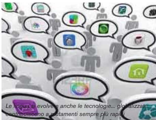
Le lingua si evolve e anche le tecnologie... globalizzate contribuiscono a mutamenti sempre più rapidi

Si potrebbe cominciare con il termine “dilazione”, che nel suo significato di “proroga, rinvio” non è molto fortunato. C’è chi dovendo pagare una bolletta, ne chiede “una diluizione”, altri “una dilatazione”. Alcuni invocano “pagamenti dilaniati” ma, sia chiaro, non si vuol rinviare il saldo alle “candele greche”.