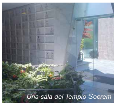
Una sala del Tempio Socrem

Vorrei inoltre evidenziare che, il 23 maggio scorso, su proposta del mio Assessorato, la Giunta del Comune di Pavia ha deliberato di intitolare