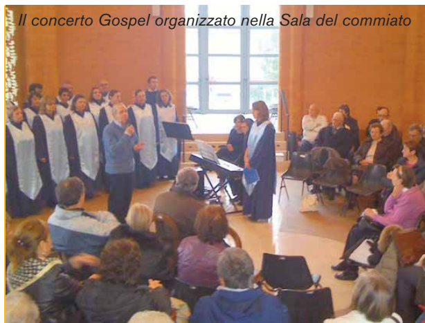
Il concerto Gospel organizzato nella Sala del commiato

per far rispettare la volontà che ciascuno, liberamente, può esprimere. La relazione morale del presidente è approvata all'unanimità.