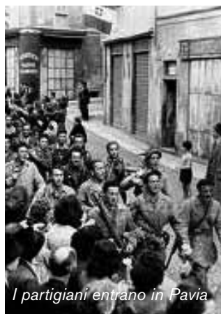
I partigiani entrano in Pavia

Alle ore 22,45 del 25 luglio il popolo italiano apprese dalla radio la caduta del fascismo. Questa data è da ricorda-