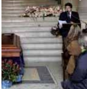
La Sala del commiato del Père Lachaise di Parigi

Al Monumentale di Pavia è a disposizione la Sala dell'accoglienza per cerimonie di addio ai propri cari. La Socrem ritiene particolarmente importante che il rito della cremazione sia accompagnato da una cerimonia capace di attribuire solennità al momento della separazione da un familiare defunto. Il rito del commiato è una cerimonia semplice, ma intensa per calore e solidarietà. Chi intende fruire di questo servizio deve contattare la Socrem per predisporre una cerimonia personalizzata secondo i desideri di ciascuno.