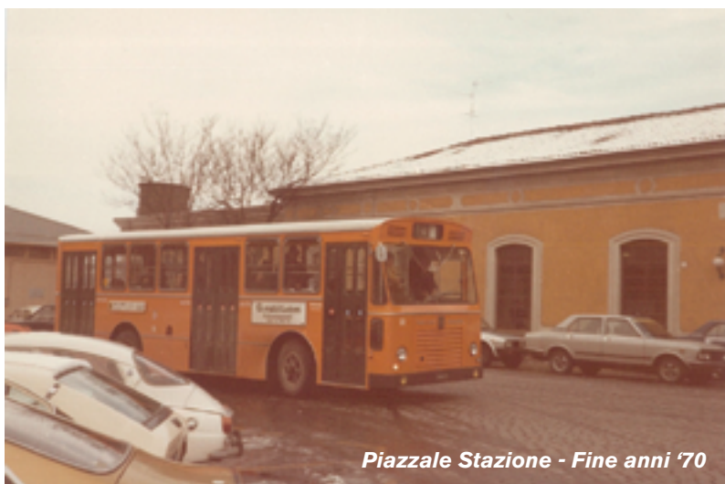
Piazzale Stazione - Fine anni '70

La consueta buona manutenzione negli anni unita a un uso molto professionale da parte del Personale di Guida portò al noleggio e alla vendita quali vetture marcianti ad altre aziende e anche un tentativo di conservazione, poi naufragata, da parte di un museo nazionale.