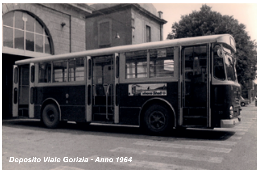
Deposito Viale Gorizia - Anno 1964

Anche questi autobus furono immessi sulla importan-