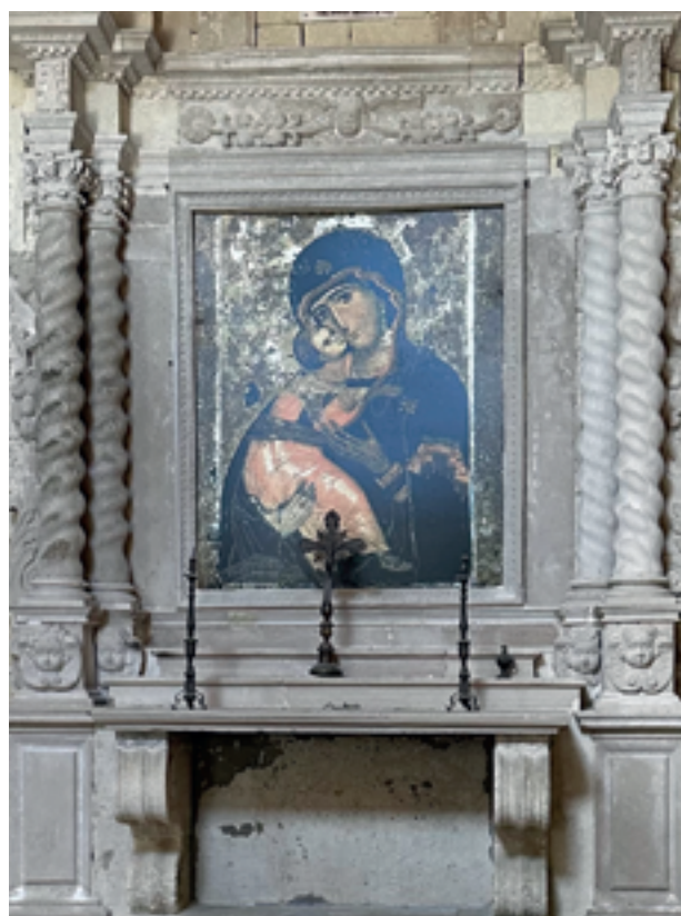
Gravina in Puglia: chiesa rupestre della Madonna della Stella

Il mio racconto termina qui e comunque non prima di rivolgervi l'invito a intraprendere l'esperienza di un cammino sia tra le innumerevoli proposte italiane che sui più noti cammini spagnoli perché, come diceva Sant'Agostino, la vita è come un libro e chi non viaggia è come se ne leggesse solo la prima pagina.