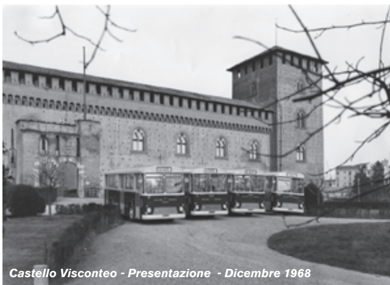
Castello Visconteo - Presentazione - Dicembre 1968

te linea 1, mentre quelli precedenti vennero assegnati promiscuamente, con quelli più vecchi, sulle linee 4 e 6. Per ragioni di capienza queste vetture non vennero mai assegnate alla linea 3, mentre facevano servizio saltuariamente anche sulle linee 5, 7 e 8.